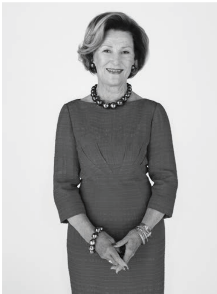
H.M. Dronning Sonja

Den Norske Opera & Balletts høye beskytter